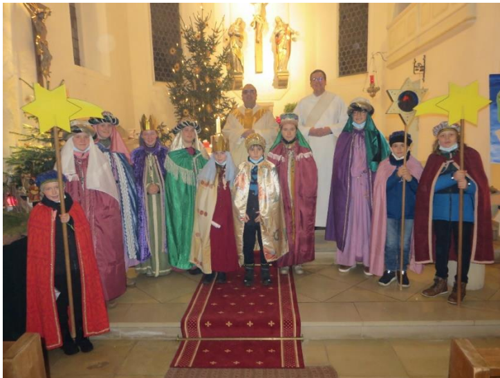
Sternsinger Untermarchtal 2022

Noch am Dienstagabend 4. Januar gingen die Sternsinger im Ort von Haus zu Haus.