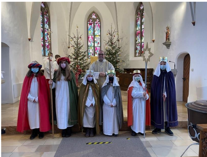
Sternsinger Neuburg 2022