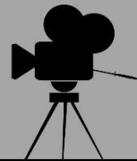
Foto - Video - SocialMedia

PASSFOTOS - ONLINE BUCHEN UNTER: WWW.TIMAIERSTOCKPHOTOGRAPHY.COM ODER TELEFONISCH UNTER 01522 8294633